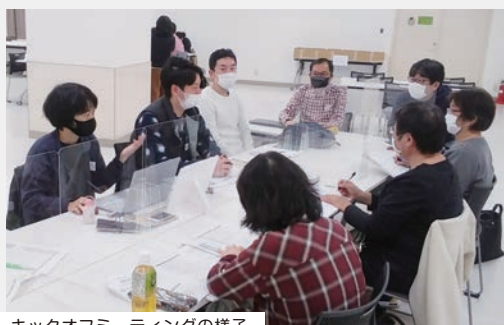
キックオフミーティングの様子