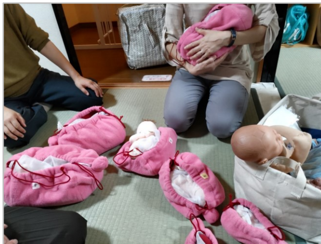
学習ツール（胎児人形）