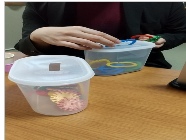
手作りおもちゃ（型はめブロック）